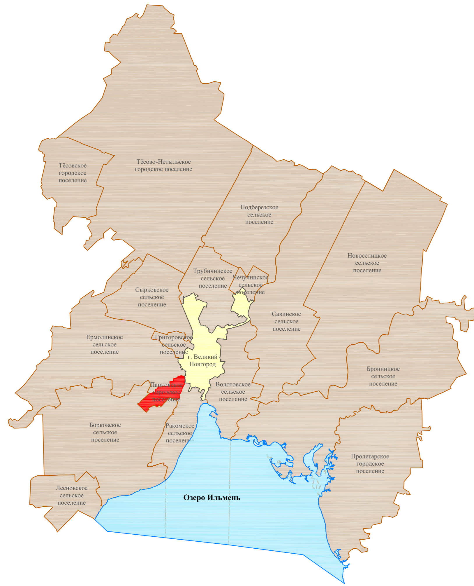
Схема расположения поселения в структуре Новгородского муниципального района